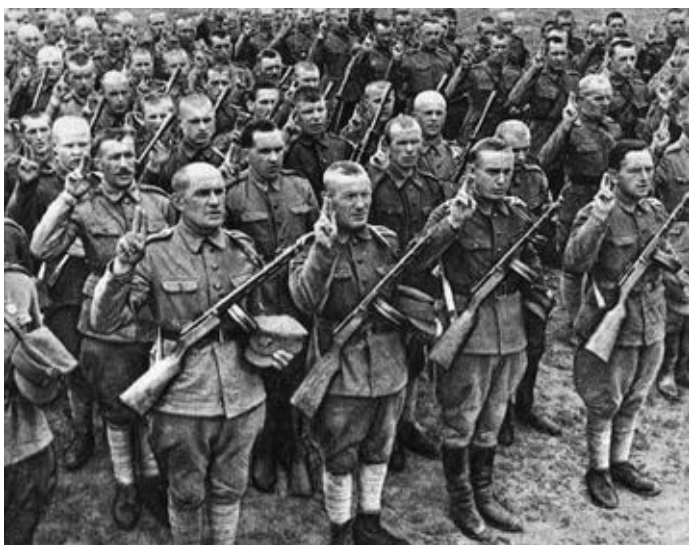
Żołnierze 1 Dywizji Piechoty podczas składania przysięgi wojskowej

W 1939 roku, po ataku Związku Radzieckiego na Polskę, wielu obywateli zostało wysłanych do łagrów lub do Armii Czerwonej. W 1941 ogłoszono formowanie Armii Andersa, lecz nie wszyscy zdołali uciec. Pojawiła się jednak kolejna szansa w 1943 r., kiedy Związek Patriotów Polskich ogłosił tworzenie Wojska Polskiego na Wschodzie i tam trafili wszyscy, którzy nie zdążyli do Andersa. Ludzie ci byli brudni, głodni, zawszeni i pamiętali, co zrobił im ich nowy wątpliwej jakości sojusznik. Zgłaszali się do tego wojska po to, żeby z karabinem w rękę wrócić do domu. Dowódcą nowego wojska został gen. Zygmunt Berling , który w 1939 roku dowodził nieczym - tak, niczym, ponieważ usunięto go z kadry oficerskiej za oszustwo w procesie rozwodowym. Natomiast większość kadry oficerskiej została skierowana z Armii Czerwonej, więc nie cenili sobie życia polskich szeregowych, ponieważ traktowali ich jako zło konieczne.